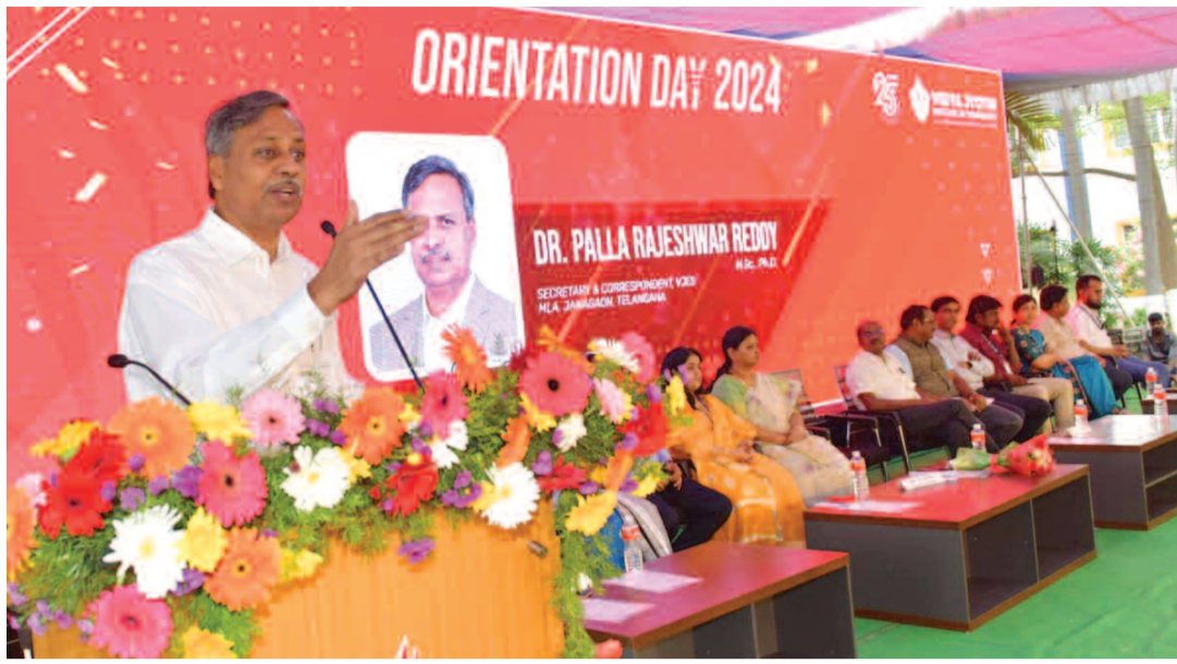
కూడా ఉండాలని ఆయన సూచించారు. నాలుగు సంవత్సరాల పాటు కష్టం అనకుండా ఇప్పంతో విద్యార్థులు చదువుకుంటే మీకు మంచి భవిష్యత్తు ఉంటుందని మీ తల్లిదండ్రులకు మంచి పేరు తెచ్చినవారు అవుతారని ఆయన తెలిపారు. ఈ కార్యక్రమంలో