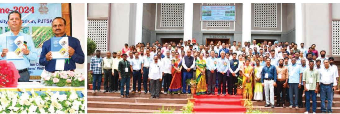
సదస్సులో పాల్గొన్న శాస్త్రవేత్తలు

బుద్గేట్, ఆగస్టు 22 (ప్రభాత ఉదయం): ప్రాజెన్సర్ జయశంకర్ తెలంగాణ రాష్ట్ర వ్యవసాయ విశ్వవిద్యాలయం ఆధ్వర్యంలో రెండు రోజులపాటు నిర్వహిస్తున్న కాస్ట్ ఆఫ్ కల్చివేషన్ పథకం జాతీయ సదస్సును గురువారం ప్రారంభిస్తుంది.