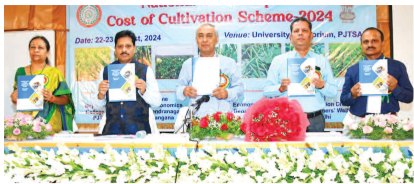
కాస్ట్ ఆఫ్ కల్చివేషన్ సావనీర్ ను విడుదల చేస్తున్న శాస్త్రవేత్తలు..

బుద్గేట్, ఆగస్టు 22 (ప్రభాత ఉదయం): ప్రాజెన్సర్ జయశంకర్ తెలంగాణ రాష్ట్ర వ్యవసాయ విశ్వవిద్యాలయం ఆధ్వర్యంలో రెండు రోజులపాటు నిర్వహిస్తున్న కాస్ట్ ఆఫ్ కల్చివేషన్ పథకం జాతీయ సదస్సును గురువారం ప్రారంభిస్తుంది.