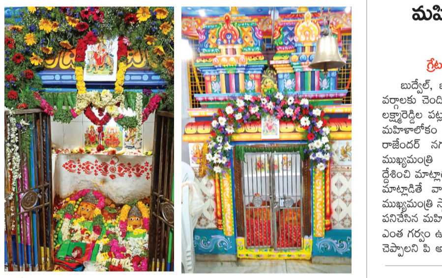
రాజేంద్రనగర్ లో కొలువు దీరిన ఈడమ్మ, భులక్ష్మమ్మ అమ్మ వార్ల దేవాలయం