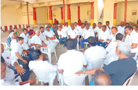
వెండికొండ ఆలయంలో సమావేశమైన నాయకులు