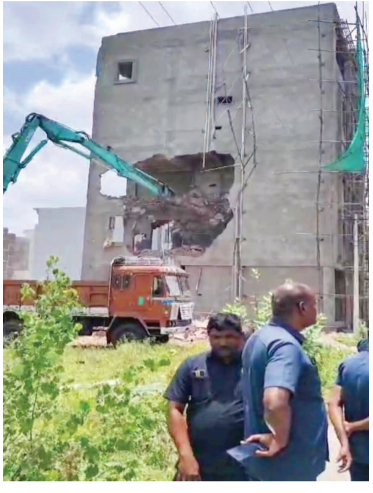
బంరుకున్ దౌలలో నిర్మించిన బహుళ లంఘన