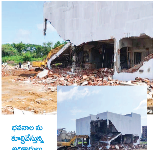
భవనాల ను కూల్చివేస్తున్న అధికారులు భవనాల కూల్చివేత