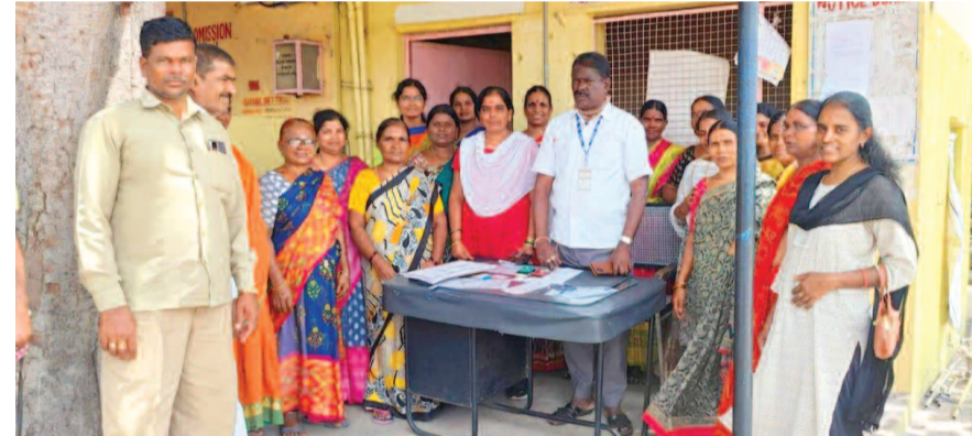
రాజేంద్రనగర్ ఆర్టీసీ బస్సు డిపో అధికారులకు వివరించేట్రం అందచేస్తున్న ఉప్పర్ పల్లి మహిళలు