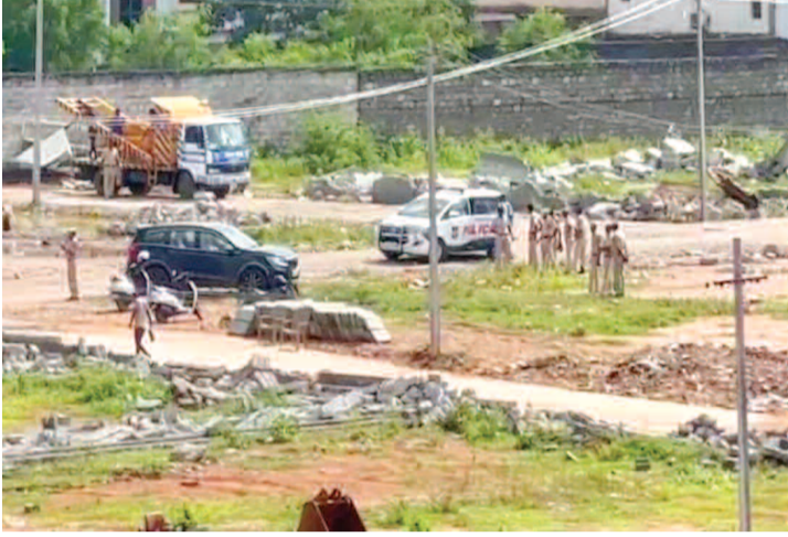
చెరువు స్థలంలో చేసిన వెంచర్