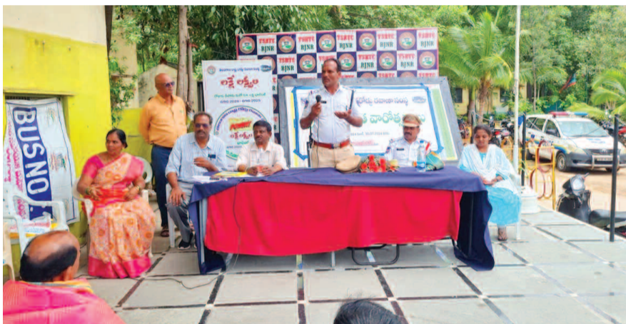
ప్రమాద రహిత వారోత్సవాల ముగింపు లో పాల్గొని మాట్లాడుతున్న రాజేంద్రనగర్ ట్రాఫిక్ ఇన్స్ పెక్టర్ నిర్వహకులు