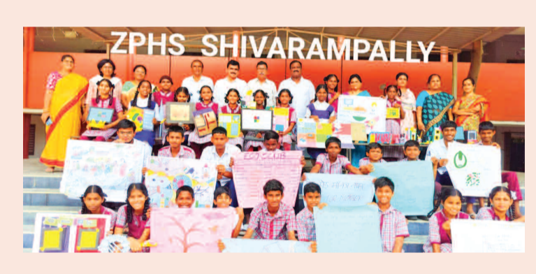
శివరాం పల్లి జిల్లా పరిషత్ ఉన్నత పాఠశాలలో జరిగిన శిక్షా సప్తమా కార్యక్రమంలో పాల్గొన్న విద్యార్థులు, ఉపాధ్యాయులు