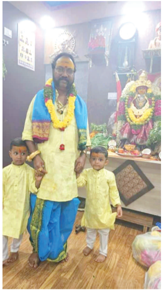
మునుముళ్లతో బ్రహ్మణపల్లి బాల్ రాజ్