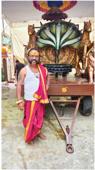
ఫలహారపు బండి ని నిర్ధం చేస్తున్న బ్రాహ్మణ పల్లి బాల్ రాజ్