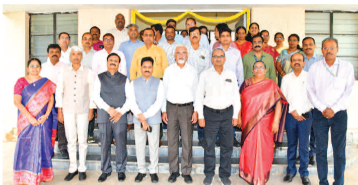
నేల ఆరోగ్యంపై జరిగిన సదస్సులో పాల్గొన్న శాస్త్రవేత్తలు

ప్రాంతాలు మారు మోగాయి. నగరం నలుమూలల నుంచి వచ్చిన పోతురాజులు ప్రత్యేక ఆకర్షణగా నిలిచారు. నల్ల పోవమ్మ, కడమ్మ దేవాలయాల వద్ద ఫలహారపు బండి పూజలు నిర్వహించారు.