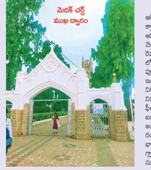
మెదక్ చర్చ్ ముఖ ద్వారం