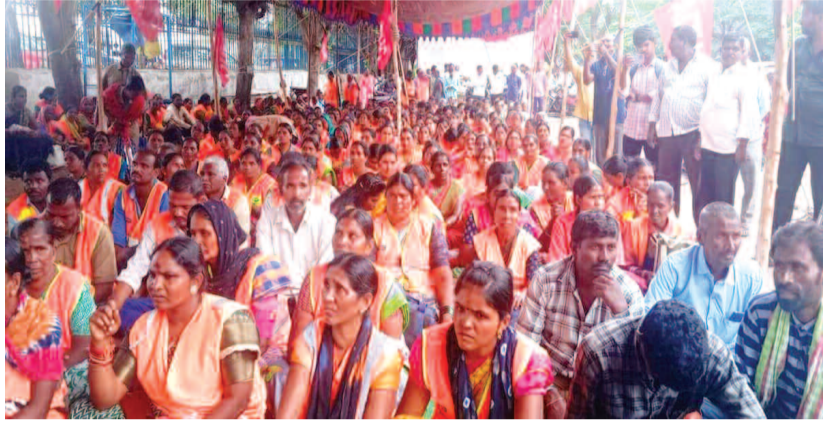
ధర్మాలో పాల్గొన్న మున్సిపల్ కార్మికులు