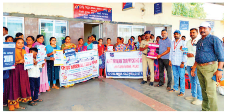
మానవ అక్రమ రవాణా చేస్తే కఠిన చర్యలు