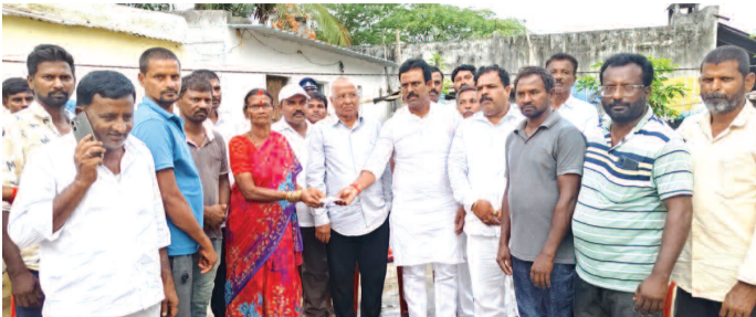
మృతుల కుటుంబాలకు ఆర్థిక సహాయం అందజేస్తున్న ఎమ్మెల్యే జిఎంఆర్