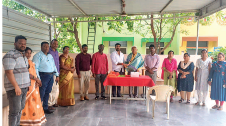
వైద్యులను సన్మానిస్తున్న లక్ష్మీనివాస్