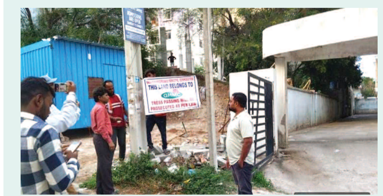
సెస్టిక్ ట్యాంకు స్థలంలో ఇది జీహెచ్ఎంసీ స్థలం మూలం బ్యానర్ కట్టిన రాజేంద్రనగర్ సర్కల్ అధికారులు