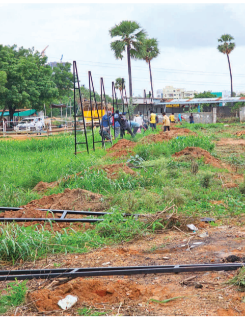
కోర్టు అధికారులు చేస్తూ స్థలంలో అక్రమంగా పాల్కొనే పాటుకున్న కట్టాదారులు