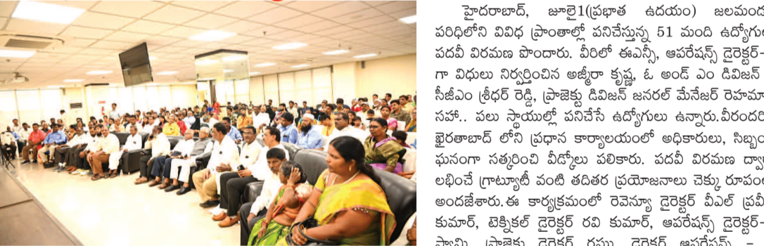
వీధిలు సమావేశంలో పాల్గొన్న జలమండలి, అధికారులు నిజుంబి