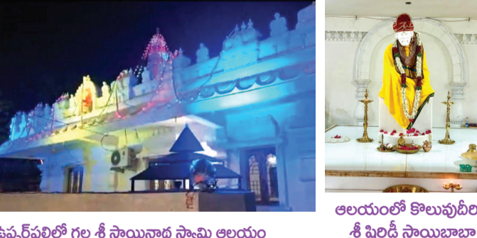
ఉప్పర్ పల్లిలో గల శ్రీ సాయినాథ స్వామి ఆలయం శ్రీ పిల్లడి సాయిబాబా