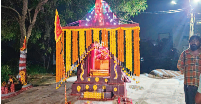
అందంగా ముసాబైన మధుబన్ కాలనీ పోచమ్మ దేవాలయం