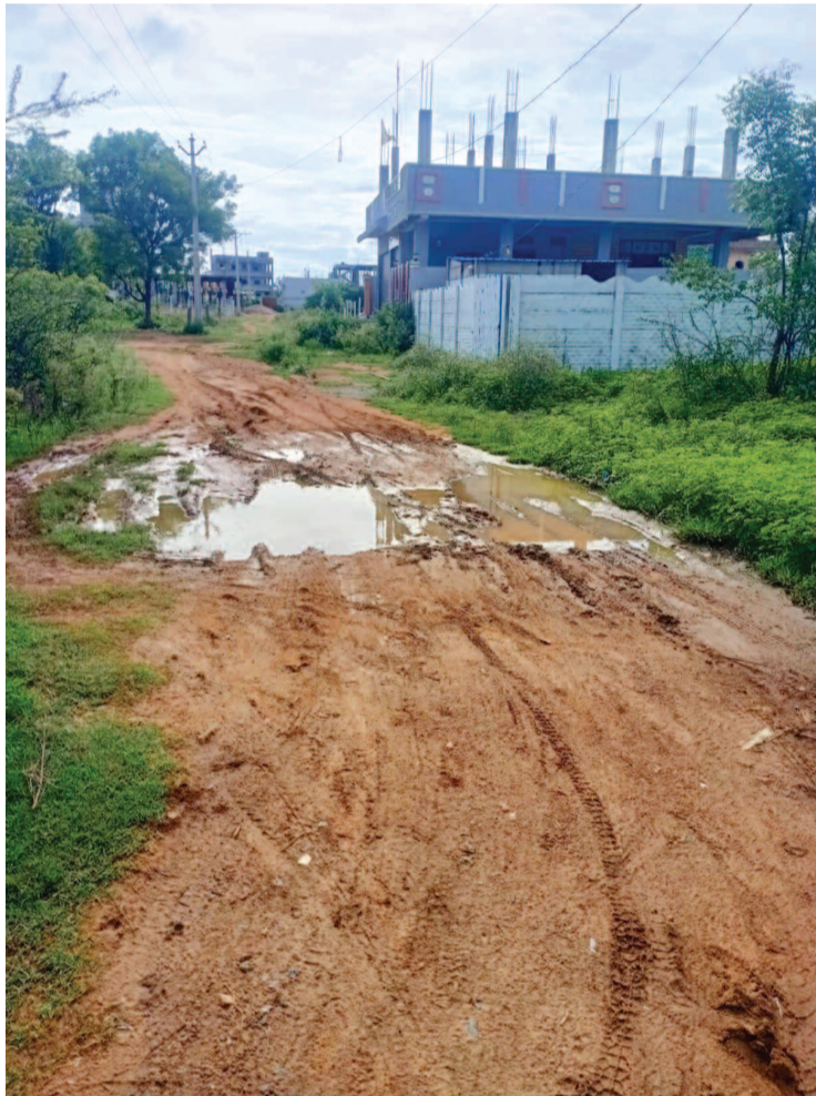
వెంకటేశ్వర కాలనీలో గుంతలు పడి బురదమయంగా మారిన రోడ్డు