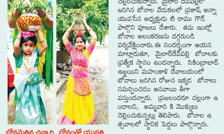
బోనాలపై చిన్నారు బోనాలతో యువతి