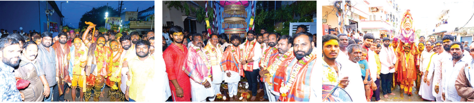
లక్ష్మీ గూడలో బోనాల ఉత్సవాలు