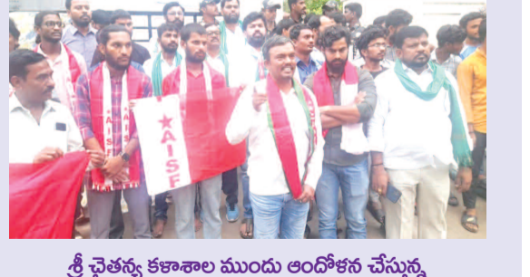
శ్రీ చైతన్య కళాశాల ముందు ఆందోళన చేస్తున్న గిరిజన సమాఖ్య ప్రతినిధులు