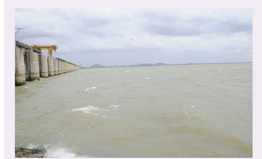
జారాల ప్రాజెక్టులో జరుగుతున్న నీటిపట్టం

టూరిజం హబ్, రావకొండ ప్రాంతంలో అద్భుతమైన ఫిల్డ్ ఇండస్ట్రీ కూడా ఏర్పాటు చేయబోతున్నామని తెలిపారు. ఇప్పటికే అద్భుతంగా రామోజీ ఫిల్మ్ సిటీ ఉందని.. దాంట్లో దేశవ్యాప్తంగా ఉన్న సినిమావాళ్లు వచ్చి మాచింగులు జరుపుకుంటున్నారని.. ఇక అంతకంటే మిన్నగా మరో ఫిల్మ్ సిటీని ప్రభుత్వం నిర్మిస్తుందని వెల్లడించారు.