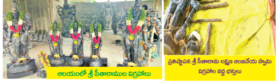
ఆలయంలో శ్రీ సీతారామల విగ్రహాలు