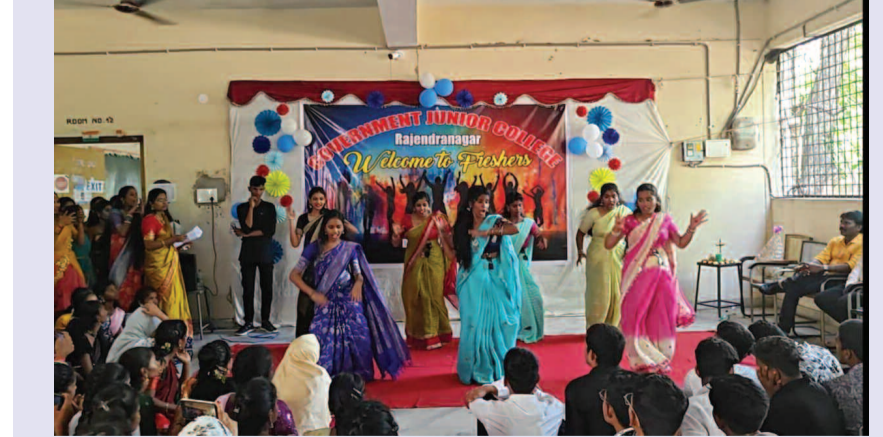
ప్రెషర్స్ డే లో స్వీట్స్ సీనియర్ ఇంటర్ విద్యార్థులు