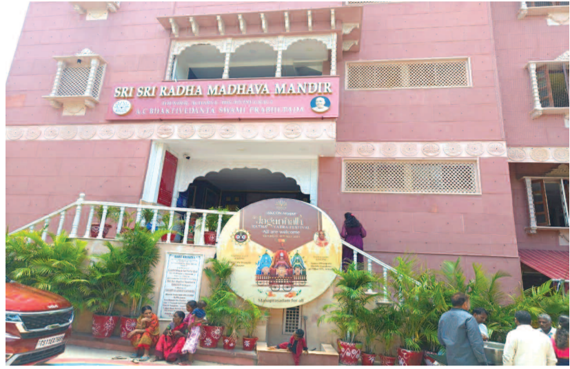
అత్తాపూర్ లోని ఇస్కాన్ టెంపుల్