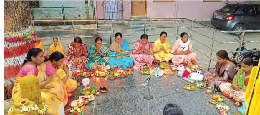
పూజలలో పాల్గొన్న భక్తులు