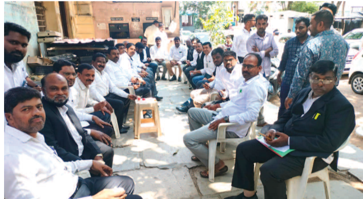
నిరసన తెలుపుతున్న న్యాయవాదులు