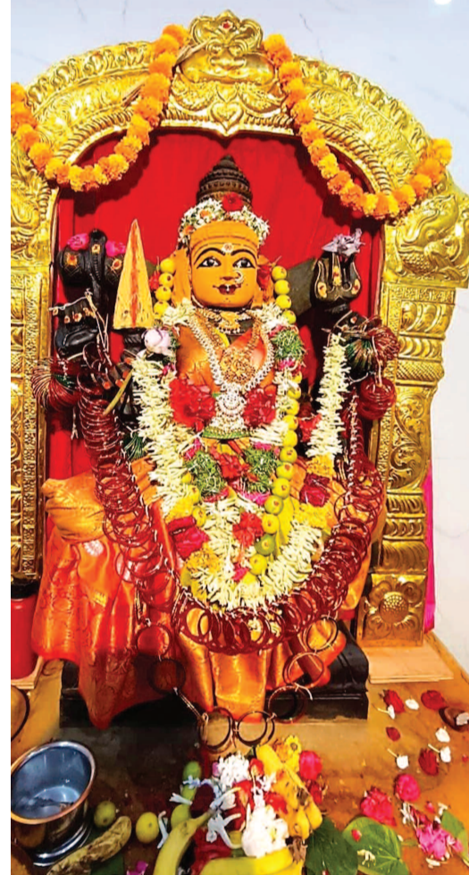
బుద్వేల్ శ్రీ కట్ట మైసమ్మ అమ్మవారు

బుద్వేల్, జూలై 11 (ప్రభాత ఉదయం): బుద్వేల్ శ్రీ కట్ట మైసమ్మ దేవాలయంలో వారాహి దేవి నవరాత్రి మహోత్సవాలు ఘనంగా కొనసాగుతున్నాయి. అమ్మవారిని ప్రతిరోజూ ప్రత్యేకంగా అలంకరిస్తున్నారు. స్థానిక ప్రాంతాలకు చెందిన భక్తులు పెద్ద సంఖ్యలో హాజరై పూజా కార్యక్రమాలు నిర్వహిస్తున్నారు. గురువారం దేవాలయ అవరణలో నిర్వహించిన పూజా కార్యక్రమంలో స్థానిక ప్రాంతాలకు చెందిన మహిళా భక్తులు పెద్ద సంఖ్యలో హాజరయ్యారు. ప్రతిరోజూ దేవాలయంలో వేద పండితుల మంత్రోచ్ఛారణ మధ్య పూజా కార్యక్రమాలు నిర్వహిస్తున్నారు. దేవాలయానికి వచ్చే భక్తులకు ఇబ్బంది కలగకుండా నిర్మాణాలు భారీ ఏర్పాట్లు చేపట్టారు.