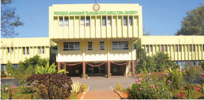
వ్యవసాయ విశ్వవిద్యాలయం పరిపాలన భవనం