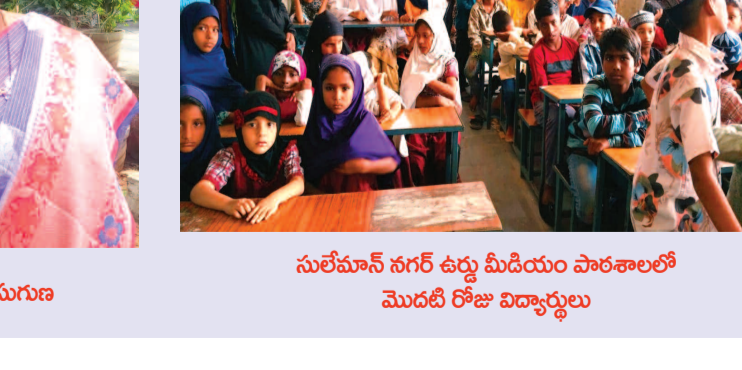
సులేమాన్ నగర్ ఉర్దూ మీడియం పాఠశాలలో మొదటి రోజు విద్యార్థులు