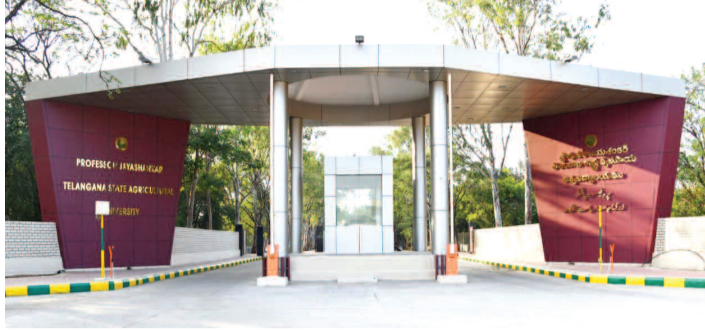
వ్యవసాయ విశ్వవిద్యాలయం ముఖ ద్వారం