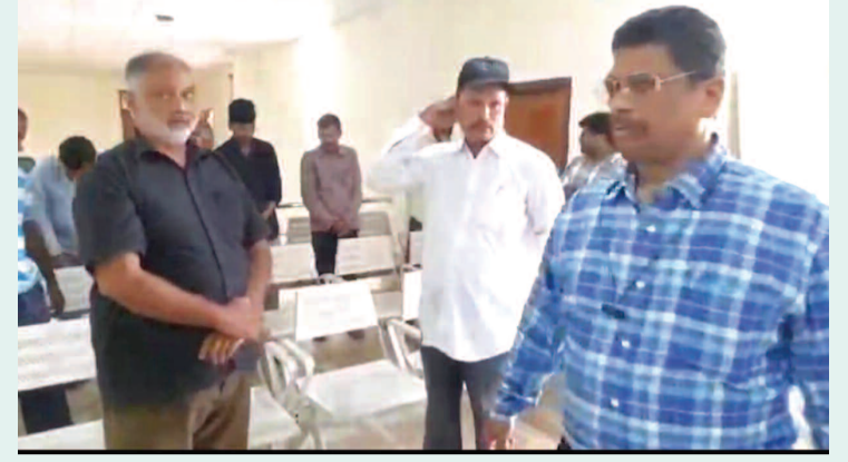
మణికొండ లోని రంగారెడ్డి డిడిసి కార్యాలయంలో తనిఖీ చేస్తున్న ఏసీబీ అధికారులు