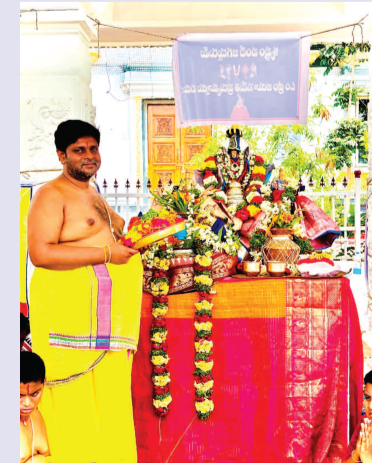
పూజలలో వేద పండితులు