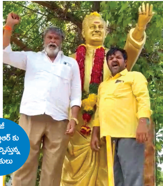
మాజీ సీఎం ఎన్టీఆర్ కు నివాళులర్పిస్తున్న నాయకులు