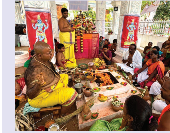
కాటేదాన్ శ్రీ వెంకటేశ్వర కొండ పై వెలసిన శ్రీ వెంకటేశ్వర స్వామి దేవాలయంలో పూజలు