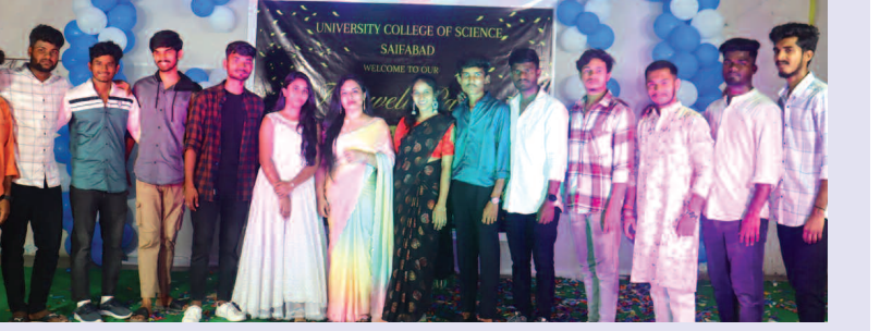
బీసీపి ఫైవల్ ఇయర్ విద్యార్థులు

చింతల్ బస్సీ అంబేద్కర్ కమ్యూనిటీ హాల్ లో సంబరాలు చేసుకున్న విద్యార్థులు హైదరాబాద్, మే19(ప్రభాత ఉదయం) : సైబరాబాద్ పీజీ కళాశాలలో బీసీపి చదువుతున్న విద్యార్థులు ఆదివారం చింతల్ బస్సీ అంబేద్కర్ కమ్యూనిటీ హాల్ లో ఫేర్ వెల్ పార్టీ నిర్వహించారు. బీసీపి మొదటి, ద్వితీయ సంవత్సరం చదువుతున్న విద్యార్థులు ఫైవల్ ఇయర్ విద్యార్థులకు వీడ్వాల పలుకుతూ ఫేర్ వెల్ పార్టీ ఇచ్చారు.