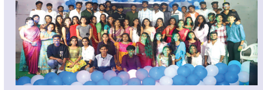
సైబరాబాద్ పీజీ కాలేజీ లోని బీసీపి డిపార్ట్ మెంట్ ఫేర్ వెల్ పార్టీలో పాల్గొన్న విద్యార్థులు