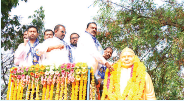
నివాకులు అల్పస్వల్న రాజేంద్రనగర్ ఎమ్మెల్యే టి. ప్రకాష్ గౌడ్