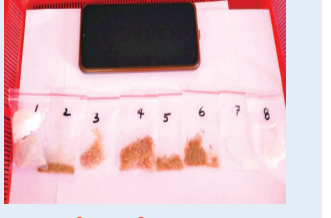
స్వాధీనం చేసుకున్న 15 గ్రాముల ఎం డి ఎం ఏ డ్రగ్, సోల్ ఛోస్