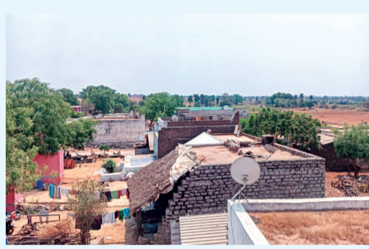
చమాన్ ఖాన్ డొడ్డి గ్రామ నేపథ్యం..

పదిరోజుల్లో ఇల్లు విడిచి పోవాలంటు నోటీసులు జారీ. తాత, ముత్తాతల నుండి ఇదే ఊరిలో ఉన్నాం. ఖాళీ చేసే ప్రసక్తి లేదంటున్న గ్రామస్థులు. ఈ ఊరు మాది.. ఖాళీ చేయాలి, కోర్టును ఆశ్రయించిన పట్టణులు గ్రామాన్ని ఖాళీ చేయాలంటూ హుకుం.... రాజకీయ నేతలు, పోలీసుల ద్వారా ఒత్తిడి. మూడు తరాల నుంచి ఇక్కడే ఉంటున్నాం.. ఊరొదిలి పొమ్మంటే ఎలా అంటూ ఆవేదన వ్యక్తం చేస్తున్న గ్రామస్థులు?