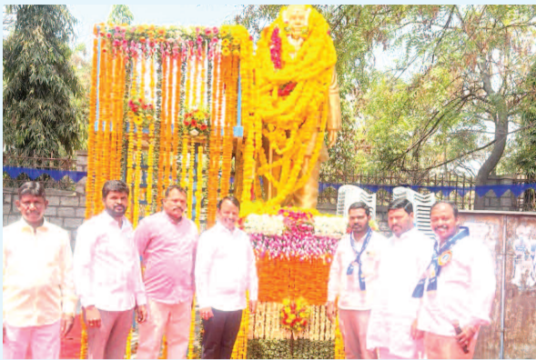
బుద్వేల్లో నివాకులు అల్పస్వల్న జర్నలిస్టులు, నాయకులు