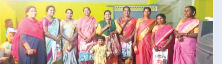
మహిళా దినోత్సవంలో పాల్గొన్న స్నేహ మహిళా పొదుపు సంఘం సభ్యులు