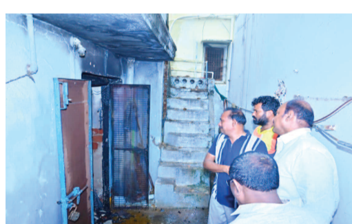
ప్రభుత్వ పరంగా ఆదుకుంటూ: జడ్పీ చైర్ పర్సన్ సలహా షార్ట్ సర్క్యూట్ కారణంగా వస్త్ర దుకాణం దగ్ధం కావడంతో జడ్పీ