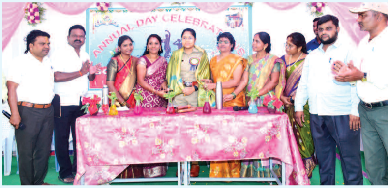
ఎస్సీ రిటరజ్ ను సన్మానిస్తున్న మహిళా అధ్యక్షులు