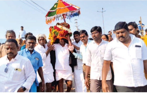
అమ్మవారిని తీసుకు వస్తున్న పూజారులు