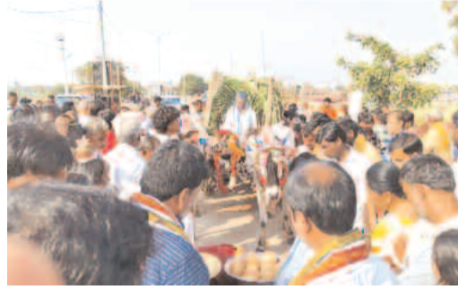
అమ్మవారిని దర్శించుకున్న జడ్పీ చైర్మన్ సలహా

జనసంద్రంగా ఆలయం గద్వాల జిల్లా ప్రతినది, ఫిబ్రవరి 21(ప్రభాత ఉదయం)నడిగడ్డ ఇంటిల్ని శ్రీజమ్మలమ్మ అమ్మవారు బుద్ధవారం పుట్టినింటి నుంచి మెట్టి నింటికి చేరుకుంది. తన తల్లి గ్రామమైన గుర్రంగడ్డ నుంచి బుద్ధవారం జోగుకొండ గద్వాల జిల్లా జమ్మచేరులోని మెట్టినింటికి వచ్చింది. అమ్మవారిని తీసుకురా వడానికి మంగళవారం సాయంత్రం ఎడ్ల బండి వెళ్లగా, సాయంత్రానికి గుర్రంగడ్డకు చేరుకుంది. అక్కడ ప్రత్యేక