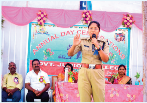
కళాశాల లో జరిగిన విద్యార్థుల వీడియో కార్యక్రమంలో ప్రసంగిస్తున్న ఎస్సీ రిటరజ్

చిన్న చిన్న సమస్యలకు భయపడవద్దు విద్యార్థులు తమ గోల్స్ ను రోజు గుర్తు చేసుకుంటూ కష్టపడితేనే చేరుకోగలరు ఇంటర్ ద్వితీయ సంవత్సర విద్యార్థుల వీడియో కార్యక్రమంలో జిల్లా ఎస్సీ రిటరజ్