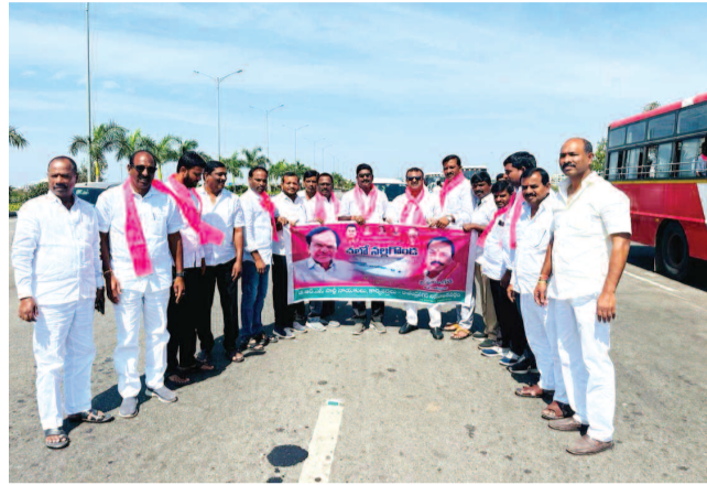
నల్గొండ సభకు బయలుదేరుతున్న శంషాబాద్ నాయకులు